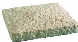
Chapeau de pilier BRIDOIRE L. 42 x l. 42 x H. 7 cm