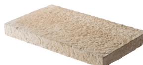
Chapeau de mur BRIDOIRE L. 40 x l. 24 x H. 5 cm L. 50 x l. 30 x H. 5 cm