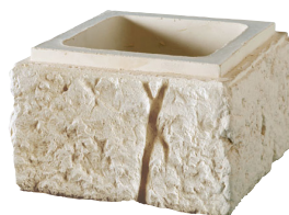
Élément boisseau droit et gauche BRIDOIRE L. 35 x l. 35 x H. 20 cm