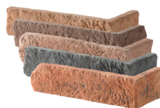
Angle L. 22 x l. 10 x h. 5 Épaisseur 2 cm