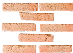
Parement L. 22 x h. 5 Épaisseur 2 cm