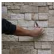
2 - J'élimine le surplus de colle