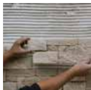
1 - Je pose

Utilisez exclusivement les produits ORSOL, ils vous assurent un travail bien fait et vous offrent la garantie produit ORSOL. Ne jamais utiliser de produits à base d'acide pour la pose ou l'entretien.