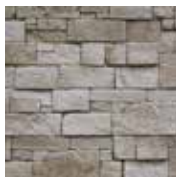
3 - J'hydrofuge pour l'extérieur

MATERIEL NECESSAIRE : Peigne 9x9x9, truelle, niveau, crayon, seau, malaxeur, colle ORFLEX, pulvérisateur et hydrofuge ORSOL si pose en extérieur.