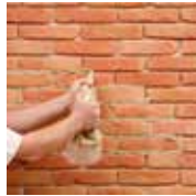
2 - Je réalise les joints