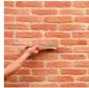
3 - Je brosse et j'hydrofuge

Calepinage = Façon de disposer les éléments de parement pour obtenir un ensemble harmonieux