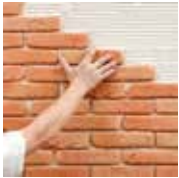
1 - Je pose en croisant les joints d'une rangée sur l'autre